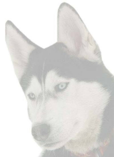
Eddy Nutz Campleiter Transpillersee Sled Dog Club